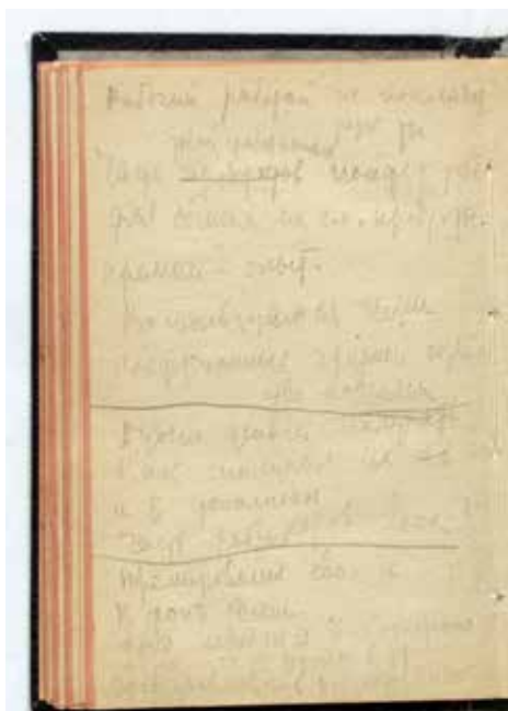
Записная книжка № 8. Л. 34 об., Государственный музей В.В. Маяковского Notebook no. 8. P. 34 back, Mayakovskiy State Museum

можно с достаточным основанием считать относящимся к «Окну ГПП» № 142 [4, с. 510].