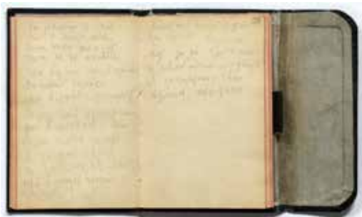
Записная книжка № 8. Л. 23 об.–24, Государственный музей В.В. Маяковского

Подготовительные материалы к Окнам «Эй, товарищи, за труд!» (ГПП № 150, рис. В.О. Роскина), «Чем без дел...» (ГПП № 151, не разыскано), «День в маевочку мою...» (ГПП № 152, рис. А.М. Нюренберга), «При буржуях...» (ГПП № 153, рис. М.М. Черемных), «Вот за то, что я пою...» (ГПП № 154 (?), не разыскано) представляют собой пять четверостиший, записанных на двух страницах записной книжки (л. 23 об., л. 24) как одно стихотворение (См. [4, с. 556]). Первое, третье и четвертое четверостишия совпадают с текстом сохранившихся трафаретных оттисков «Окон» ГПП №№ 150, 152 и 153. Второе и пятое, по-видимому, были использованы в не дошедших до нас «Окнах» № 151 и № 154 (или № 155). «Окна» делались к празднику 1 мая, но, по-видимому, были подготовлены заблаговременно, в середине апреля 1921 г.