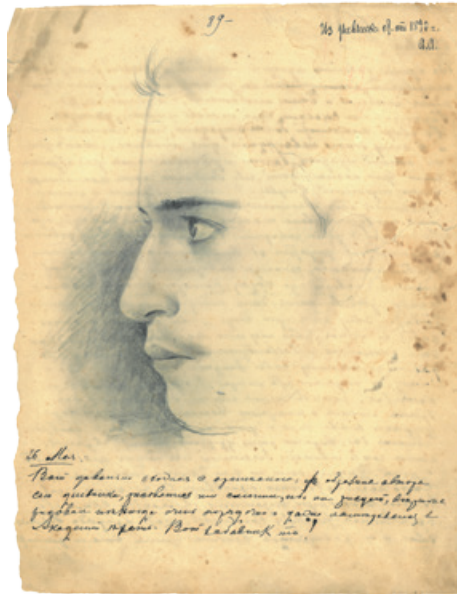
Л. Андреев. Автопортрет на страницах дневника 1890 г., 26 мая: «Вот довольно сходная с оригиналом образина автора сего дневника, рисованная им самим...». Русский архив в Лидсе (Leeds Russian Archive). MS.606/ E.1. Л. 46.

Один из пиков — видимо, кульминационный — этой драмы приходится на весну 1892 г., по возвращении Андреева в Петербург после рождественских каникул, проведенных в Орле. В дневнике он так описывает эти события: «Приехал я сюда битком набитый мрачными мыслями и намерениями. Денег, а с ними и надежд на будущее не было никаких. Пьяная безобразная жизнь в Орле отразилась на душевном состоянии. Раскаяние, упреки совести, а с другой стороны, мнимая или действительная невозможность изменить свое поведение, остановиться на наклонной плоскости — делали положение безвыходным. Выход был один — самоубийство. Здесь в Петербурге начались неприятности с З<инаидой> — и я в конце концов в субботу на масляной совершил попытку на самоубийство. В оправдание