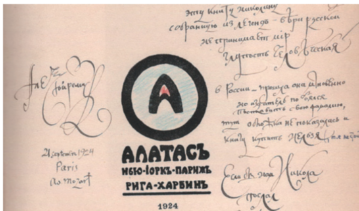
Ремизов А. Звенигород Окликанный: Николины Притчи. Париж; Нью-Йорк; Рига; Харбин: Алтас, 1924. Фрагмент авантюла с дарственной надписью С.П. Ремизовой-Довгелло. 27 сентября 1924 г. РО ИРЛИ

Пока бьется сердце и горит в вас желание – жив дух в душе не престанет жизнь: новый город вы постройте и будет он краше и поваднее всех городов новый город окликанный!