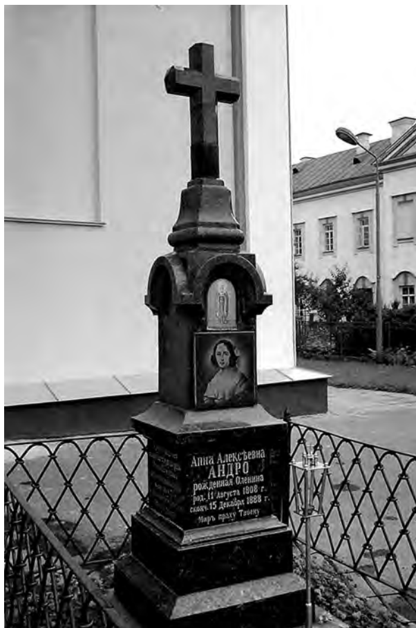
Могила Анны Олениной-Андро на кладбище Троицко-Корицкого монастыря.

избран в почетные вольные общники Академии художеств по любви к искусству 100 .