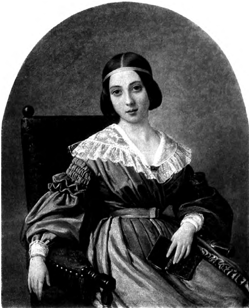
П.Н. Орлов. Анна Алексеевна Оленина. 1839. Холст, масло. Пензенская картинная галерея.

дерзкому, если он осмелится выстрелами пугать соловьев (как это случилось в 1835 г.) или похищать колеса от кузницы (как это случилось в 1834 г.)». Говоря о приютинском флоте, состоявшем из одного ялика, Савельев поясняет: «в минуту опасности <...> он может выдержать морскую битву (чему и был пример в 1834 году...)». По-